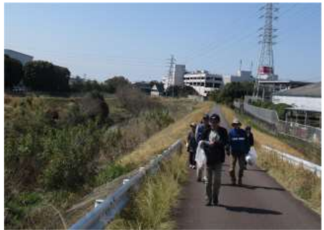
イオンから上流へ いい天気です