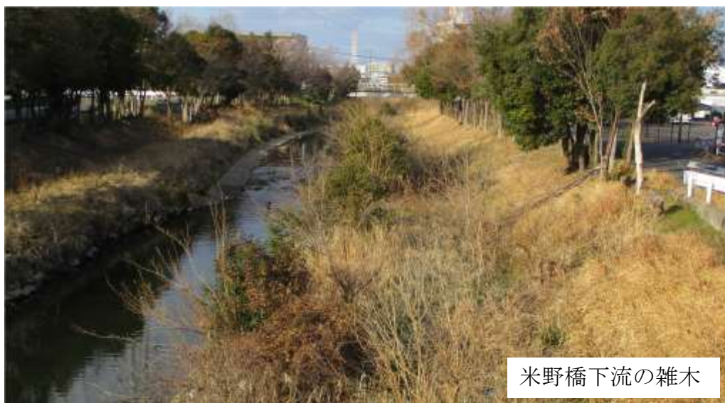
米野橋下流の雑木